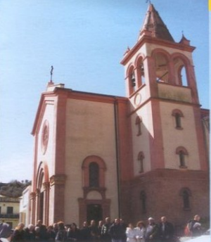
Chiesa Parrocchiale "S. Pasquale Baylan"