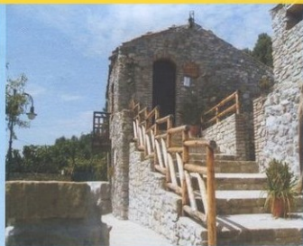
Foto casa nata di S. Gaetano